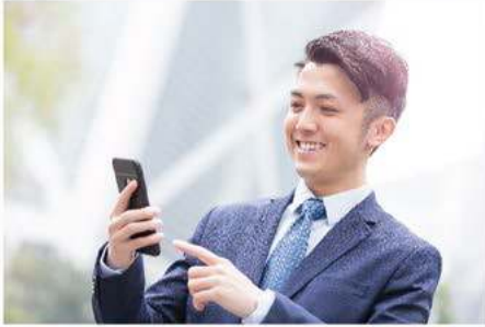
ลูกค้านักธุรกิจชาวเอเชีย

กลุ่มลูกค้า SERVICED APARTMENT ที่เป็นกลุ่มเป้าหมาย "BUSINESS TO BUSINESS"