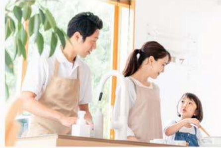
ลูกค้าครอบครัวชาวญี่ปุ่น

JAPANESE, SINGAPOREAN, TAIWANESE, HONGKONG, KOREAN