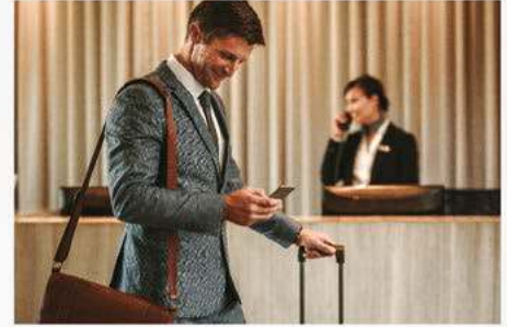
ลูกค้าต่างชาติชาวยุโรปและอเมริกา

BRITISH, SWEDISH, ITALIAN, SPANISH, GERMAN